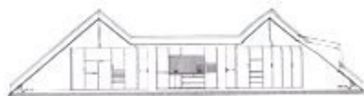
Schnitt A - A Section A - A

A niche lined with black glass is integrated into the cupboard element.