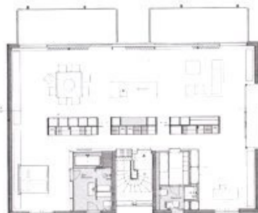
Grundriss Ground Plan